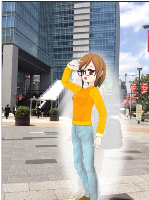
顔出し NG とのことで二次元化

会社の事務にいそうなこの人こそ、 月 10 万円を稼ぐ実力派のせどら一女子なのです。