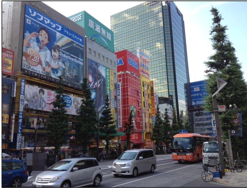
秋葉原と言えば、この通り