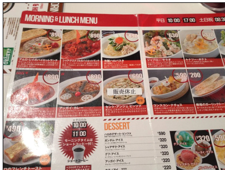
良心的な価格のガンダムカフェ

「えー！」と驚く A さんと中に入ると ガンダム一色の店内が目に飛び込んできました。