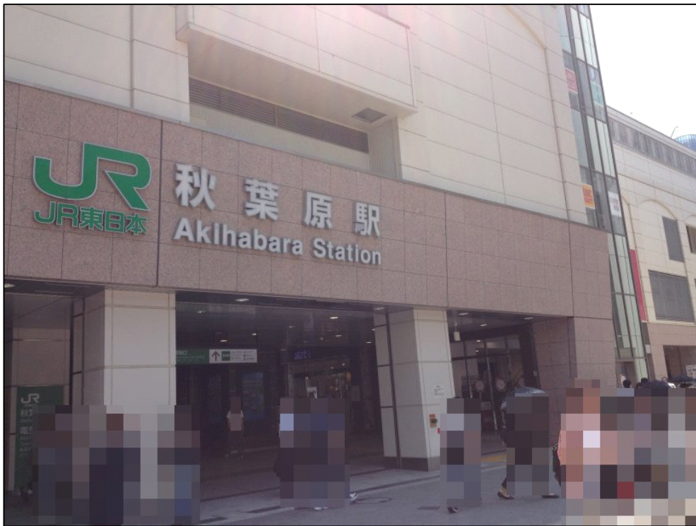
秋葉原駅の電気街口で待ち合わせ

「電気街口もキレイになったなー」 なんて見とれていると、視界に待ち合わせ相手を発見！