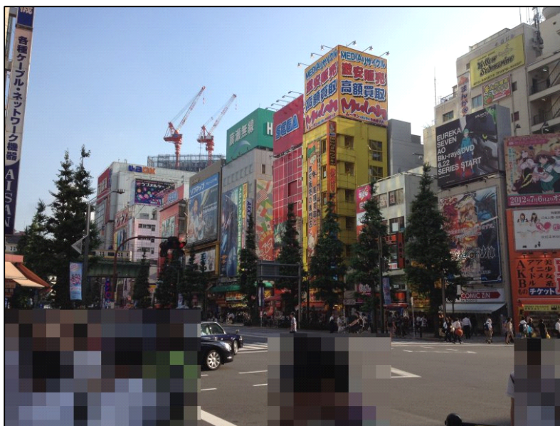
平日の昼間。けっこう人が多い